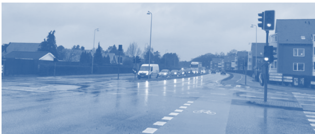
Figur 5.4. Ringvejen/Københavnsvej danner grænse mellem højrisikozonen (til højre) og risikozonen (til venstre).

Formålet med Køge Dige er at beskytte boliger for omkring 16.000 mennesker og værdier for mindst 2 mia. kr. i tilfælde af en stormflod på +2,8 m over havets middelvandstand. I 2011 blev Køge Bugt udpeget af Kystdirektoratet som risikoområde i forhold til stormflod. Siden da har Køge Kommune arbejdet på dette større kystsikringsprojekt, som omfatter etableringen af et dige, der vil strække sig over 10 km, fra Skensved Å i nord via Køge Havn området omkring Hotel Comwell i syd. Diget skal ifølge den nuværende plan (marts 2021) opbygges som et traditionelt dige med et lerlag, en kerne af sand, og græs på toppen. Mobile løsninger og højvandsmure vil ligeledes blive etableret på udvalgte strækninger fra nord til syd. For at undgå, at vandet ved stormflod trænger videre ind i baglandet via vandløbene, består løsningen også i at