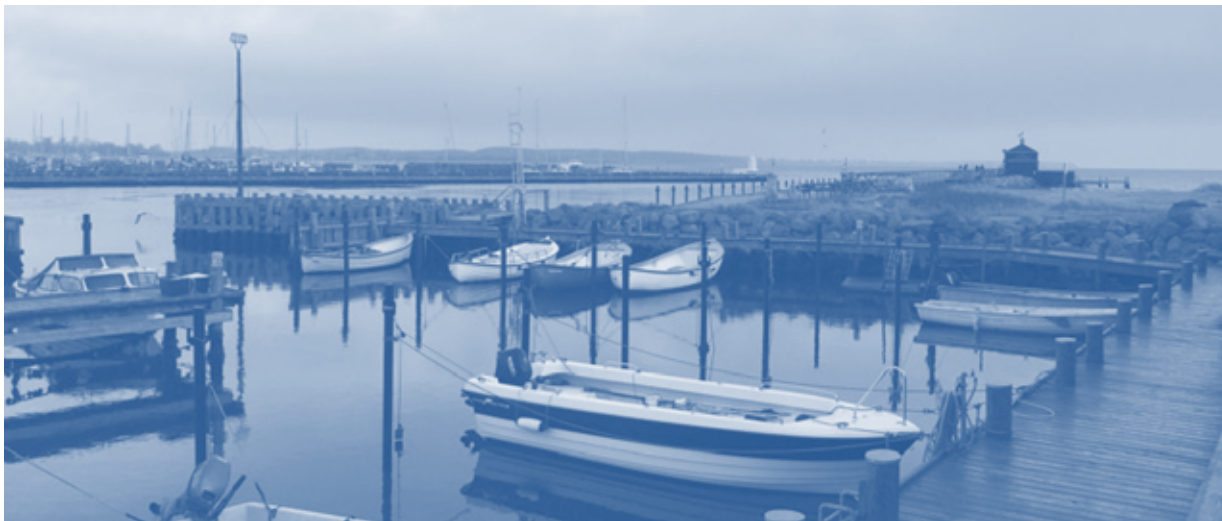
Figur 5.2. Indløbet til Kerteminde Fjord omkring jollehavnen ved den foreslåede placering af slusen.

Formålet med dette projekt er at beskytte ca. 900 private samt offentlige bygninger og ejendomme mod stormflod op til kote 2,2 m over normal vandstand i området omkring Kerteminde, Kerteminde Fjord og Kertinge Nor. Projektet blev initieret efter at tidligere stormfloder havde udløst store erstatninger fra Stormrådet, senest i år 2013. Sammenlagt har de tre seneste stormfloder forårsaget en udbetaling af skadeerstatninger for mere end 76 mio. kr. (Kerteminde Kommune, 2018a). Kerteminde Kommune har haft rollen som 'procesmyndighed' mens Kerteminde, Kølstrup og Munkebo Sluse- og Digelag har stået som projektejer og bygherre med ansvar for anlæg og drift (Kerteminde Kommune, 2019).