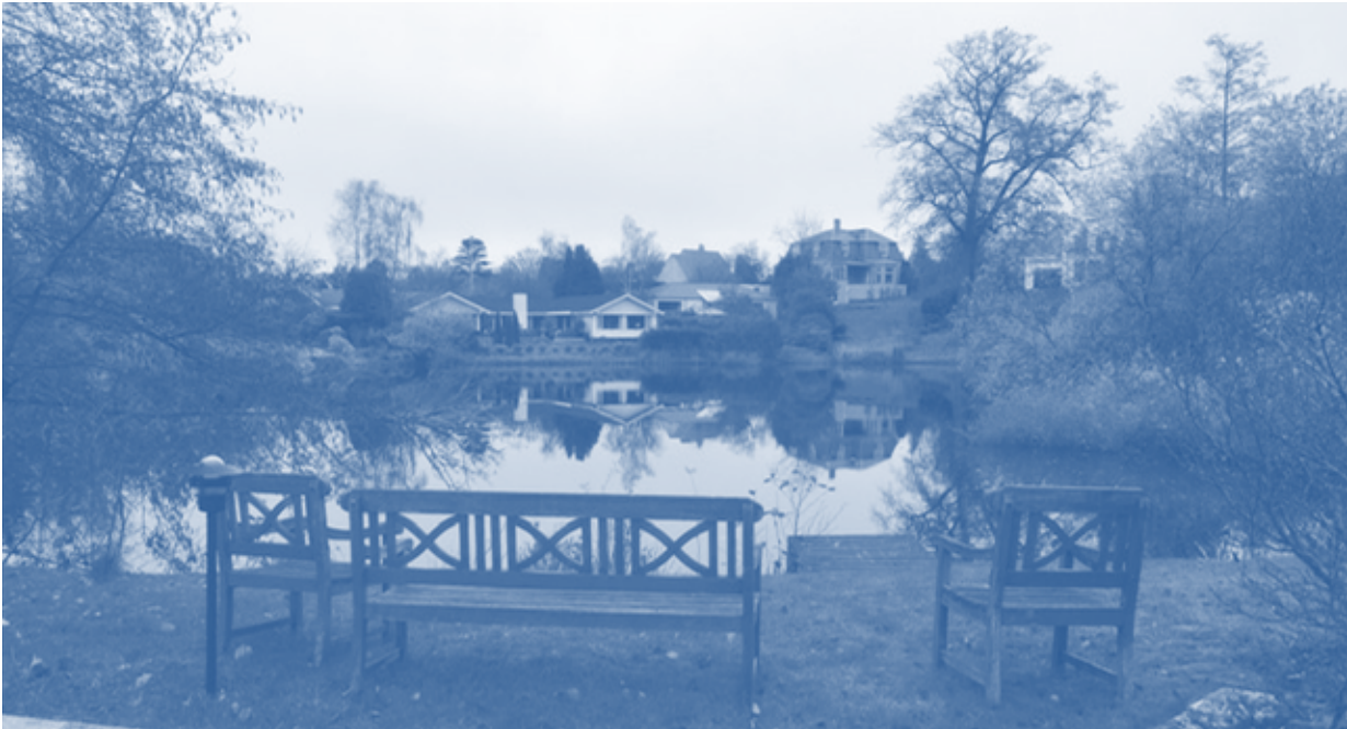
Figur 5.6. Kodammen i Hørsholm indgår som en del af oplandet til Blårenden.

Blårenden afvander et opland på ca. 4 km 2 , som både er beliggende i Hørsholm Kommune og Rudersdal Kommune. Vandløbet modtager vand fra ubefæstede arealer i oplandet, overløb fra fælleskloakerede områder og fra regnvandsudledninger (NIRAS, 2016).