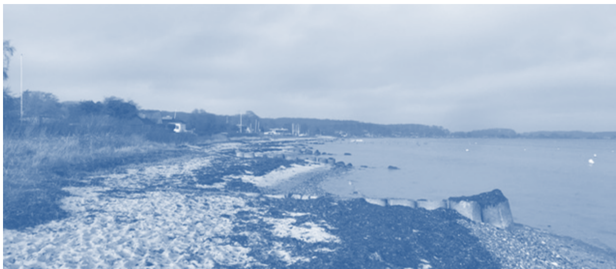
Figur 5.1. Eksisterende kystsikring ved Grønninghoved Strand set fra syd mod nord.

Formålet med projektet er at stormflodssikre sommerhusområdet Binderup-Grønninghoved i Kolding Kommune. Sommerhusområdet har ca. 250 stormflodsudsatte ejendomme. En stormflodssikring vil medføre, at området beskyttes mod stormflod op til kote +2,2 m over normal vandstand. To løsninger er foreslået: en jorddigeløsning samt en klitdigeløsning (Kolding Kommune, 2019). Anlægsomkostningerne