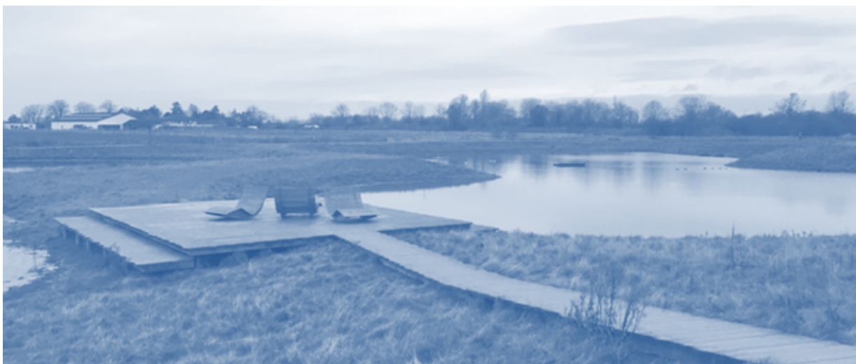
Figur 5.5. Regnvandsbassinerne i Røjlegrøften Naturpark indgår som en del af oplandet til St. Vejle Å.

Formålet med dette projekt er at klimatilpasse områder omkring St. Vejle Å på Københavns Vestegn, således at fremtidige oversvømmelser langs åen kan reduceres. Åen har i flere omgange været meget tæt på at oversvømme nærliggende huse og veje i forbindelse med skybrud, særligt i Ishøj og Vallensbæk. Initiativet til klimatilpasningsprojektet blev igangsat i 2014 af seks kommuner (Albertslund, Brøndby, Glostrup, Høje-Taastrup, Ishøj og Vallensbæk) og de tilhørende fire vandselskaber (Glostrup Forsyning, HOFOR, HTK Forsyning og Ishøj Forsyning).