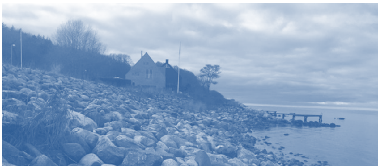
Figur 5.3. Kystområde ved Ålsgårde, der indgår som én af i alt otte strandfodringsstrækninger langs Nordkysten.

Formålet med Nordkystens Fremtid er at skabe et tværkommunalt kystbeskyttelsesprojekt for den sammenhængende nordvendte kyststrækning i kommunerne Halsnæs, Gribskov og Helsingør. Kommunerne har i fællesskab truffet en politisk principbeslutning om at et fælles kystbeskyttelsesprojekt skal etableres på Nordkysten. Projektet omfatter strandfodring med sand, grus og ral for at hindre yderligere erosion langs 35 km af den 60 km lange sjællandske nordkyst (Horten, 2016). Strandfodringen skal udføres på de strækninger, hvor der er behov for kystbeskyttelse og hvor der er bebyggelse ud til kysten. Særligt er der udpeget otte længere strandfodringsstrækninger. Der skal ikke ske strandfodring